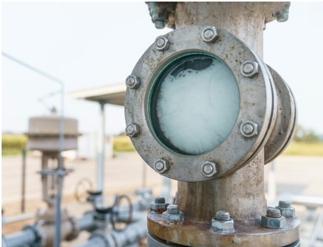
Geothermie für Thermen und innovative Lebensmittelproduktion.

Die Region Fürstenfeld ist aufgrund vorteilhafter geologischer Voraussetzungen Hotspot für Tiefengeothermie (heißes Wasser bis zu 125°C). Seit den 1970er Jahren wird das geothermische Potenzial der Region für den Betrieb von Thermen genutzt. Dass die Nutzung der Tiefengeothermie als Energiequelle auch für Industrie und Gewerbe wirtschaftlich höchst interessant ist, zeigt das jüngst erfolgreich vom Obst- und Gemüseunternehmen „Frutur“ umgesetzte Großprojekt. Weitere Tiefengeothermie-Bohrungen sind bereits in der Planungsphase.