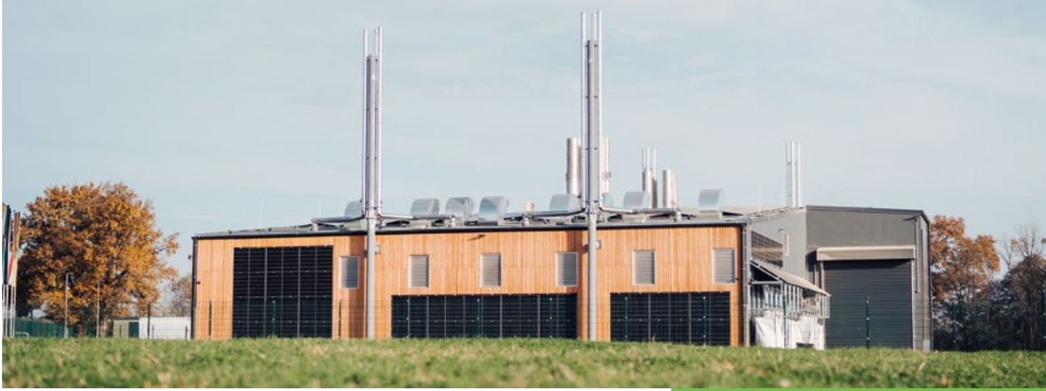
Strom und Wärme: Pellets-Holzvergaserwerk in Fürstenfeld – das größte Österreichs (2025).