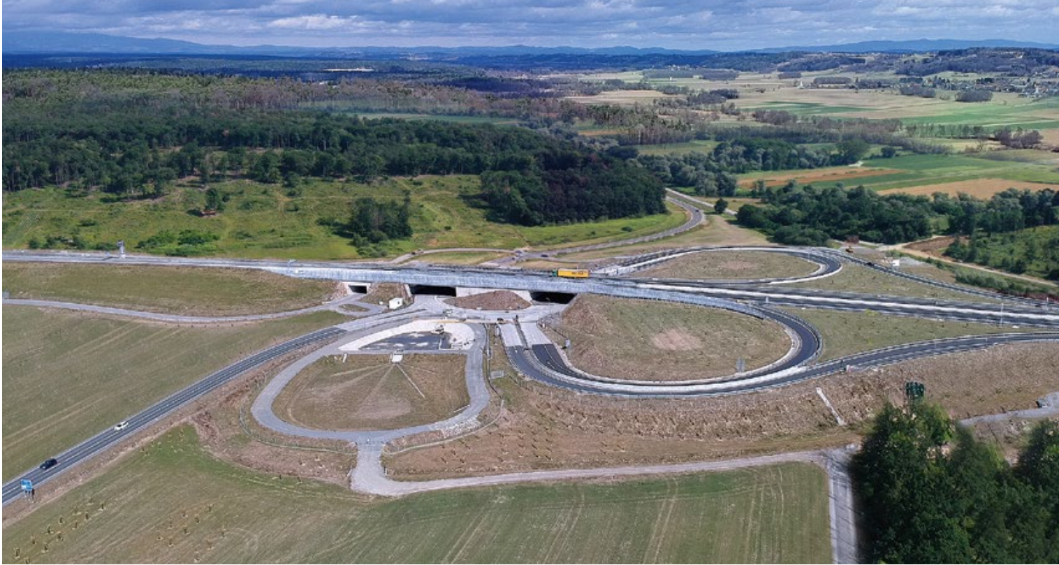
Perfekte Anbindung: Die Schnellstraße S7 bei Fürstenfeld.