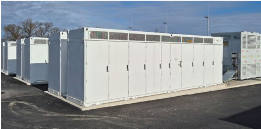
Österreichs größter Batteriestrom-Speicher (2025).