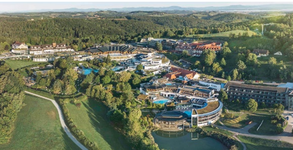
Eine der größten Thermen Österreichs: Das Thermenresort Loipersdorf.

Wussten Sie , dass über eine Million Gäste pro Jahr das wohlig warme Thermalwasser in den Thermen unseres Thermen- und Vulkanlandes „genießen“?